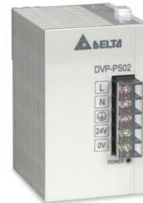
Блок питания DVPPS02