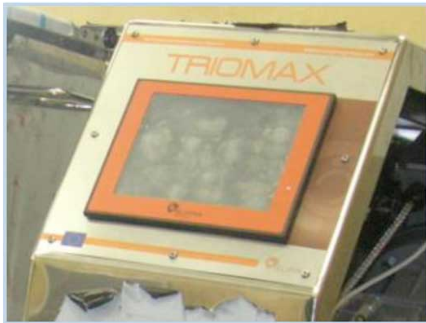
Панель управления в базовом варианте

В целях унификации оборудования и повышения надежности системы управления отсадочно-формовочной машиной TRIOMAX DROP 400 - 600 /Tf выполнена работа по внедрению на машину цветной сенсорной панели оператора DELTA DOP-B