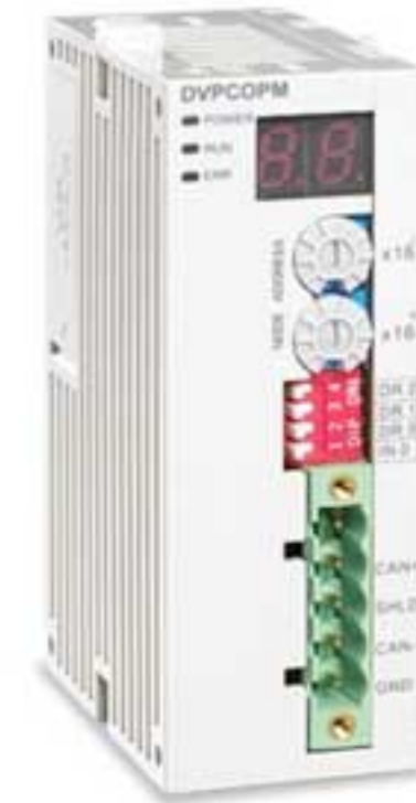
Коммуникационный модуль Canopen Master DVP-COMP