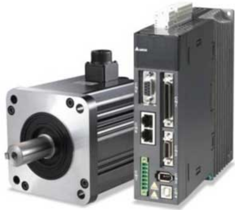
Сервопреобразователь ASD-A2 / серводвигатель ECMA