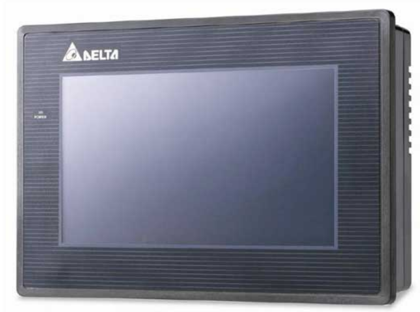
Панель оператора DELTA DOP-B