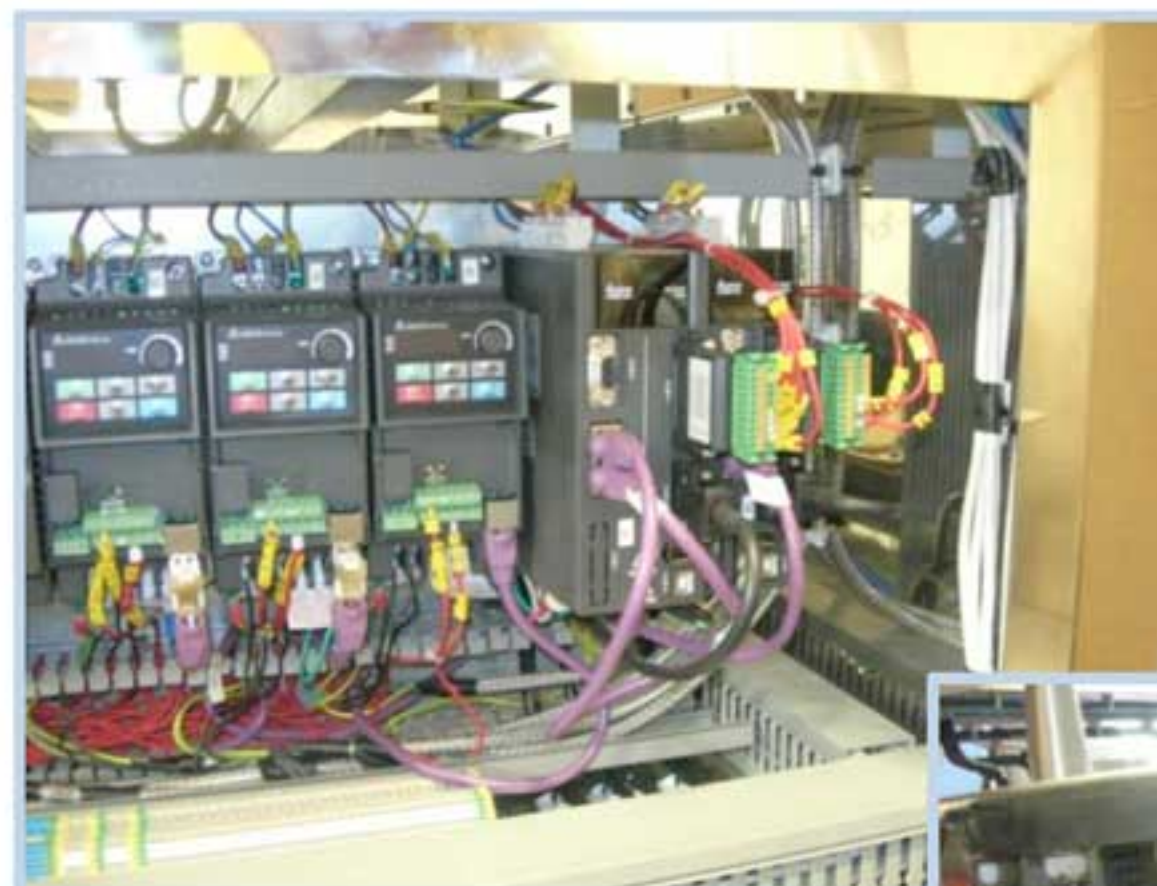
Сервоприводы DELTA ASD-A2