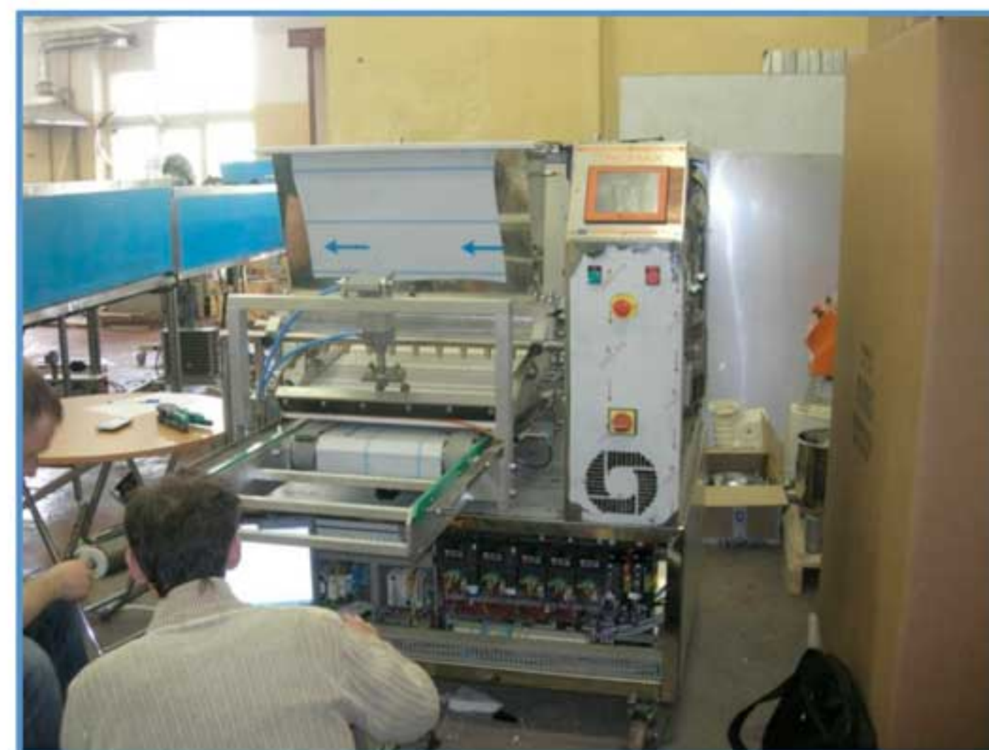
Работа по модернизации и наладке машины TRIOMAX DROP 400 - 600 /Tf