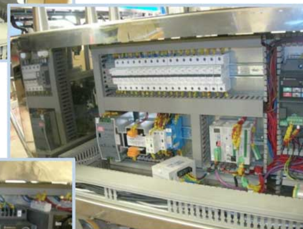
Преобразователи частоты DELTA VFD-EL