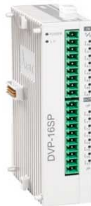
Модуль расширения дискретных входов/выходов DVP-16SP