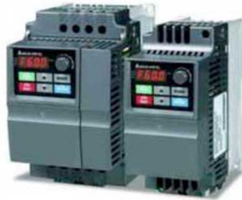
Преобразователи частоты VFD-EL (2 типоразмера)