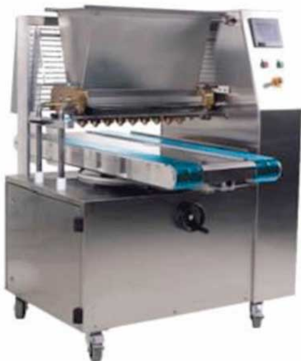
Внешний вид машины TRIOMAX DROP 400 - 600 /Tf

Новая линия отсадочных машин для кондитерских изделий с системой контроля рабочих режимов оснащена панелью управления на базе цветной сенсорной панели оператора DELTA DOP-B, позволяющая осуществлять полный контроль процесса работы оборудования и легко и просто задавать форму изделия. Приводы управляются с помощью частотных преобразователей DELTA VFD, точное позиционирование узлов машины обеспечивается сервоприводами DELTA ASDA, управление автоматикой машины осуществляется ПЛК DELTA DVP. Машина оснащена цветной сенсорной панелью для управления процессом.