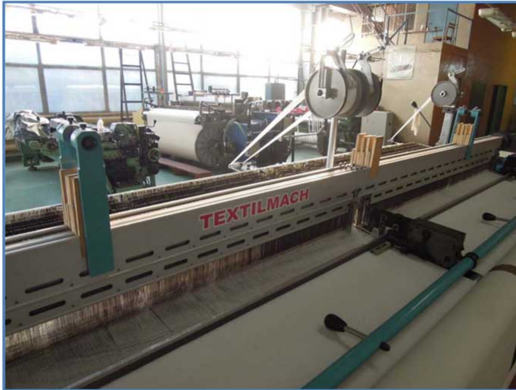
Внешний вид станка