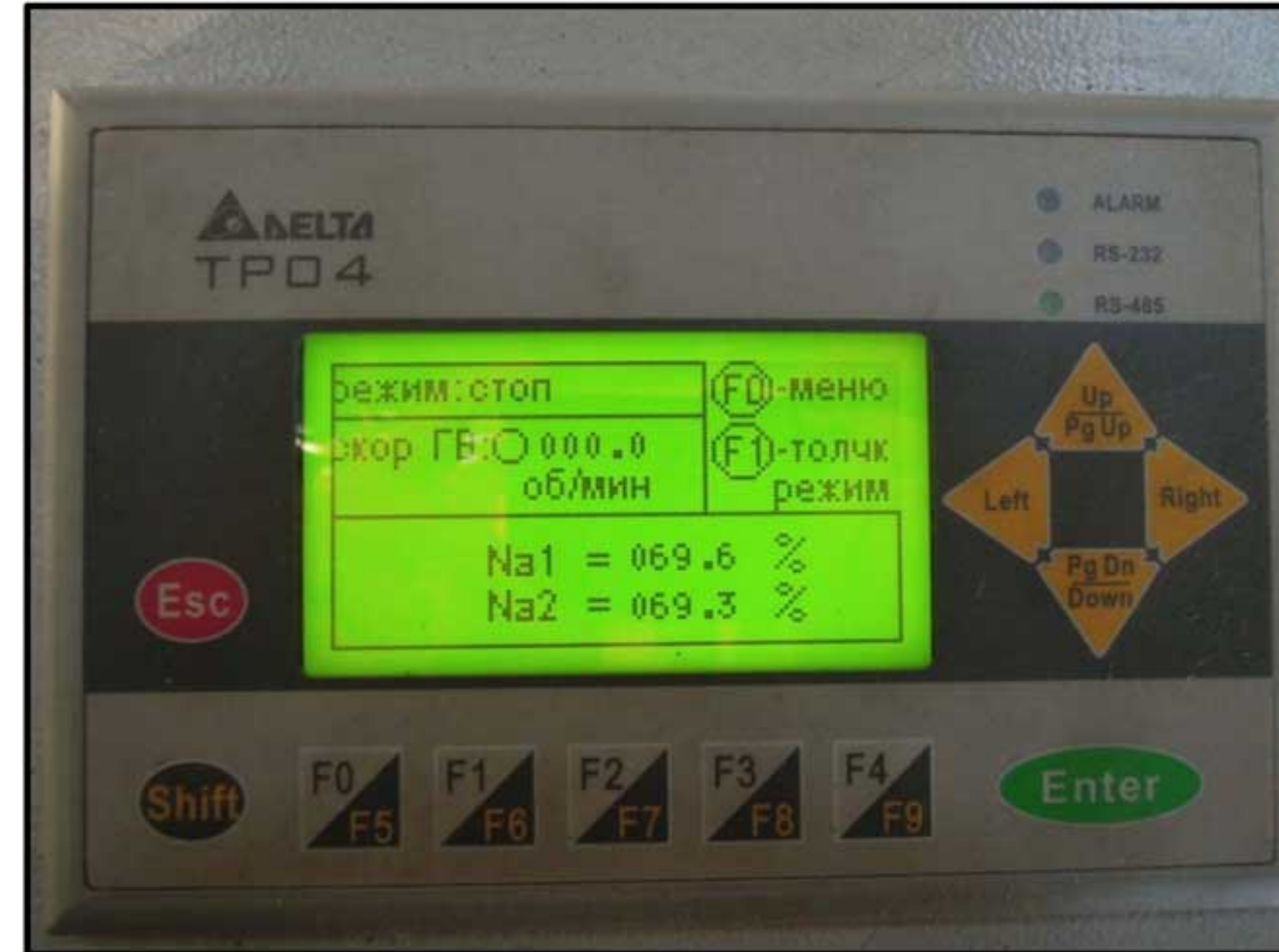
Панель оператора TP04G-AS2