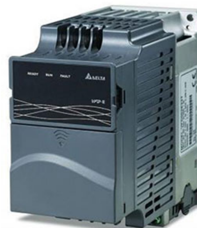
Преобразователь частоты VFD-E с пультом KPE-LE02