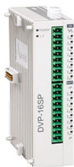
Модуль расширения дискретных входов/выходов DVP-SP