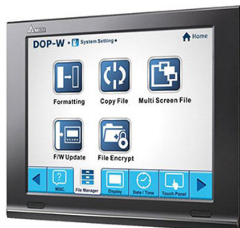
Панель оператора DOP-W