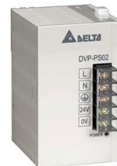
Блок питания DVP-PS02