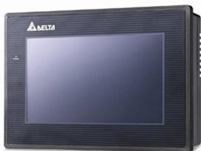
Панель оператора DOP-B