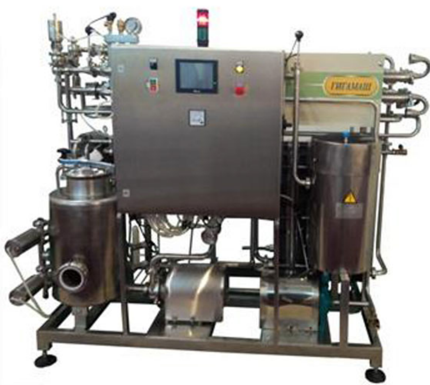
Установка пастеризационно-охладительная тип ПОУ.