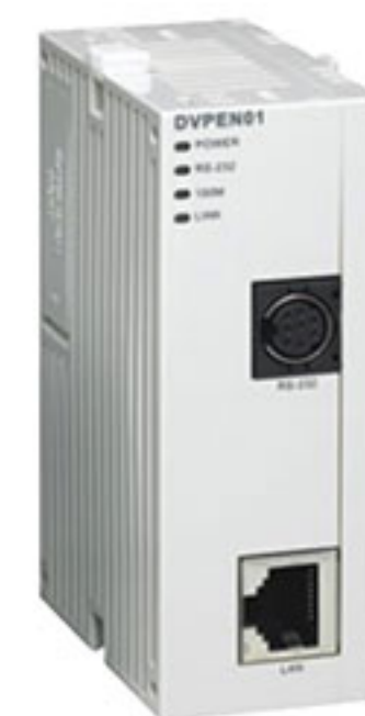
Коммуникационный модуль Ethernet DVP-EN01