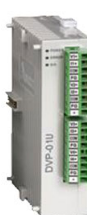
Модули расширения аналоговых входов/выходов DVP-AD/DA/XA