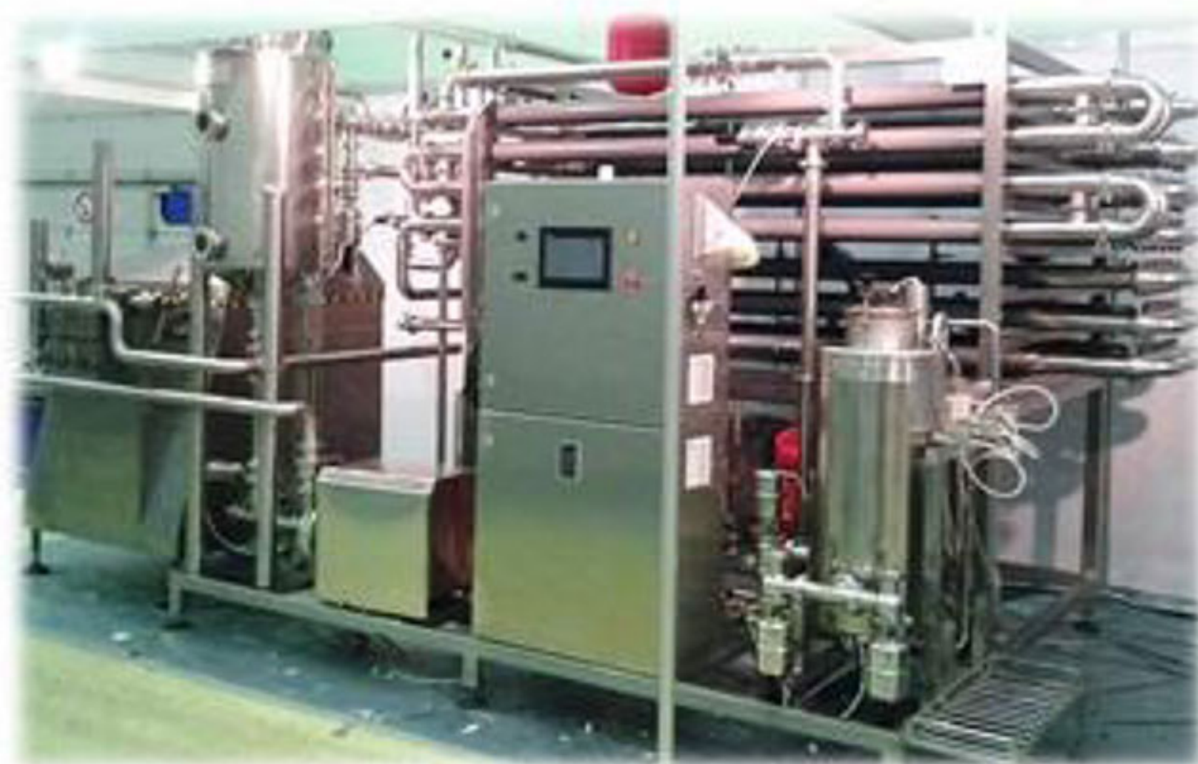
Установка стерилизационно-охладительная тип СОУ.